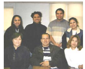
Los estudiantes de Newark

hacer realidad nuestro propio periódico.